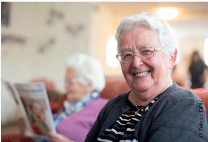
Ihre Zufriedenheit ist unser Antrieb

Gut zu wissen: Wenn Sie schon im letzten Jahr einen Pflegegrad hatten aber noch keine Leistungen bezogen haben, können Sie die „gesparten“ Monatsbeträge bis zum 30.6. des folgenden Jahres rückwirkend zusätzlich in Anspruch nehmen.