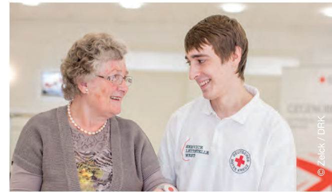
Mit Herz dabei - Wir beraten Sie gerne

Ab Pflegegrad 2 müssen Sie laut Gesetz eine regelmäßige, für Sie kostenlose Pflegeberatung in Anspruch nehmen. Wir beraten Sie unter anderem zu kostenlosen Hilfsmitteln und Zuschüssen für den barrierefreien Umbau Ihres Wohnumfelds. Auch ein Hausnotrufgerät wird, je nach Pflegegrad und Leistungsumfang, bezuschusst. Mehr dazu erfahren Sie in unserer Broschüre „Hausnotruf“.